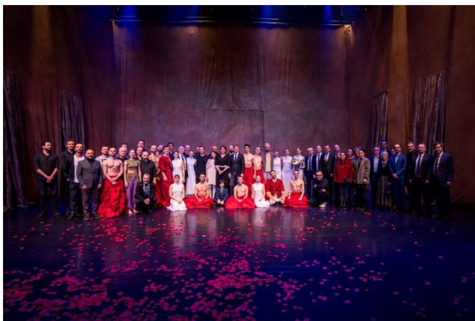
A társulat, a Török Köztársaság budapesti nagykövetség, a Török Köztársaság Kulturális és Turisztikai Minisztérium és a Nemzeti Táncszínház képviselői