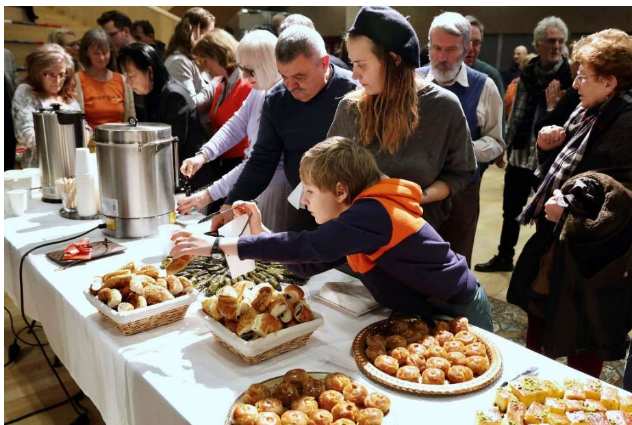
Török ízek, zenék, táncok

A magyar zenészekből álló Arasinda Zenekar adott török zenei koncertet , illetve azt követően a Duna Művészegyüttes közreműködésével táncházat tartottunk a színház előcsarnokában. 2024. január 24-én Baris Yilmaz tartott " A rózsza és a fülemüle szerelme: A török kultúra misztikus mélységeibe utazás " irodalmi kiselőadást az esti előadás előtt.