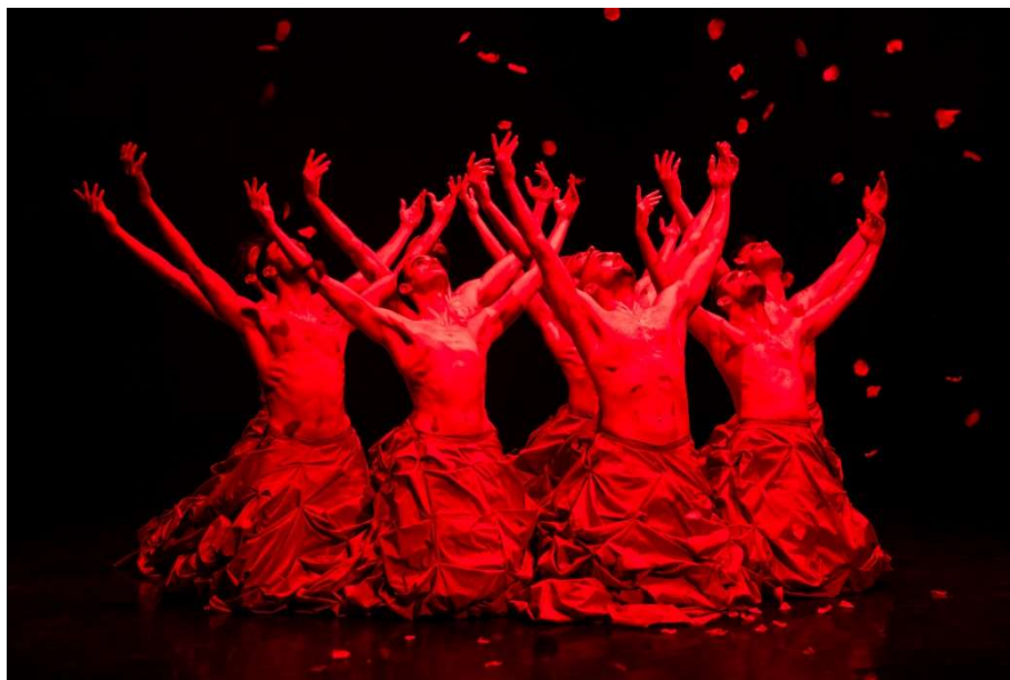
MDTistanbul (Istanbul State Opera&Ballet Modern Dance Company): Rosegarden

Egyetem modern tanszéke hallgatói számára tartottak workshopot , továbbá a színház előterében közösségtalálkozót , és pódiumbeszélgetéseket .