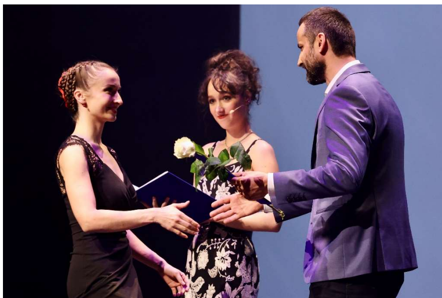
Tánc Világnapi Gála, díjátadó

Április 29-én, a Tánc Világnapján közös gálaműsorra készült a Magyar Táncművészek Szövetsége és a Nemzeti Táncszínház. A Tánc Világnapján, a Szövetséggel együttműködve gálaestet szerveztünk, amely est keretében átadták a Magyar Táncművészek Szövetségének szakmai díjait. Ugyancsak ezen az estén került sor az Imre Zoltán Alapítvány díjainak és az Ifj. Nagy Zoltán Alapítvány díjainak átadására is. A gálaesten, a díjátadásokat követően többek között, „2023 legjobb alkotója” díját elnyert koreográfus előadása került bemutatásra, a Faust, az elkárhozott című darab a Pécsi Balett előadásában.