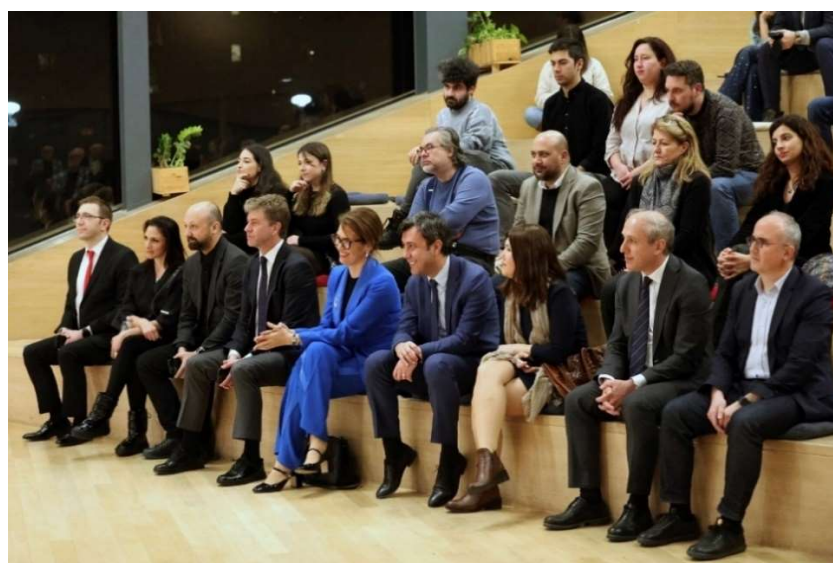
Közönségtalálkozónkon Gülşen Karanis török nagykövet asszony és a diplomáciai testület tagjai

2024. június 10-én, a Nemzeti Táncszínházban, ugyancsak a Török Magyar Kulturális Évad keretében a Konya Turkish Sufi Music Ensemble előadásában, a Whirling Dervishes-Sema Ceremony című előadását láthatta a Nemzeti Táncszínház közönsége. Az előadása után, a Meet and Greet rendezvényen Ömer Faruk Belviranlı úr, a Török Köztársaság Kulturális és Turisztikai Minisztérium képzőművészeti főigazgatója köszöntötte a megjelenteket. Az előadást a színház előterében közönségtalálkozó, pódiumbeszélgetés követte.