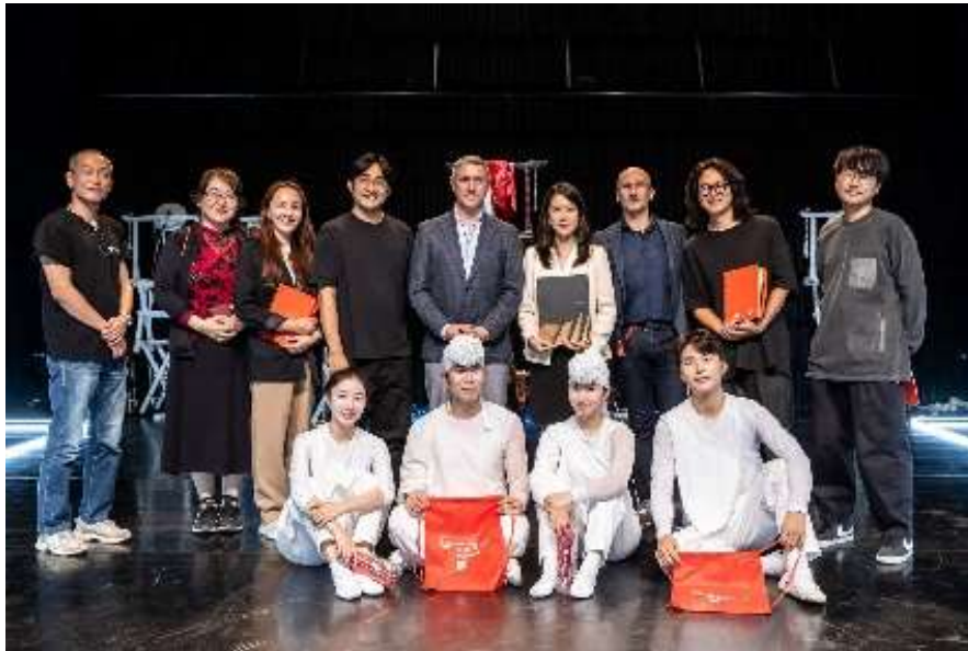
Liquid Sound társulat

2024. szeptember 27-én 19.30 órai kezdettel a Nemzeti Táncszínház kistermében, majd 29-én 19.30 órakor a Stúdiószínházi Táncfesztivál keretében Egerben a Dobó téren, a Dél-Koreából érkező Liquid Sound társulat mutatta be LONG: 1. Yeonhee Projekt című előadását. A vendégszereplés létrejöttében együttműködő partnerünk a Koreai Kulturális Központ volt.