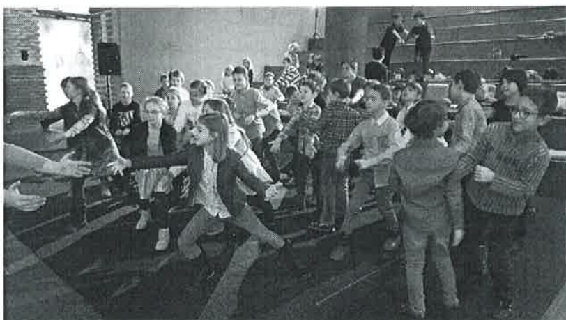
Cinegekirályfi felkészítő foglalkozás a Várkert Bazárban