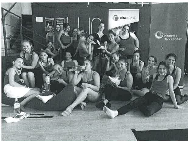
Nyári Táncfúzió