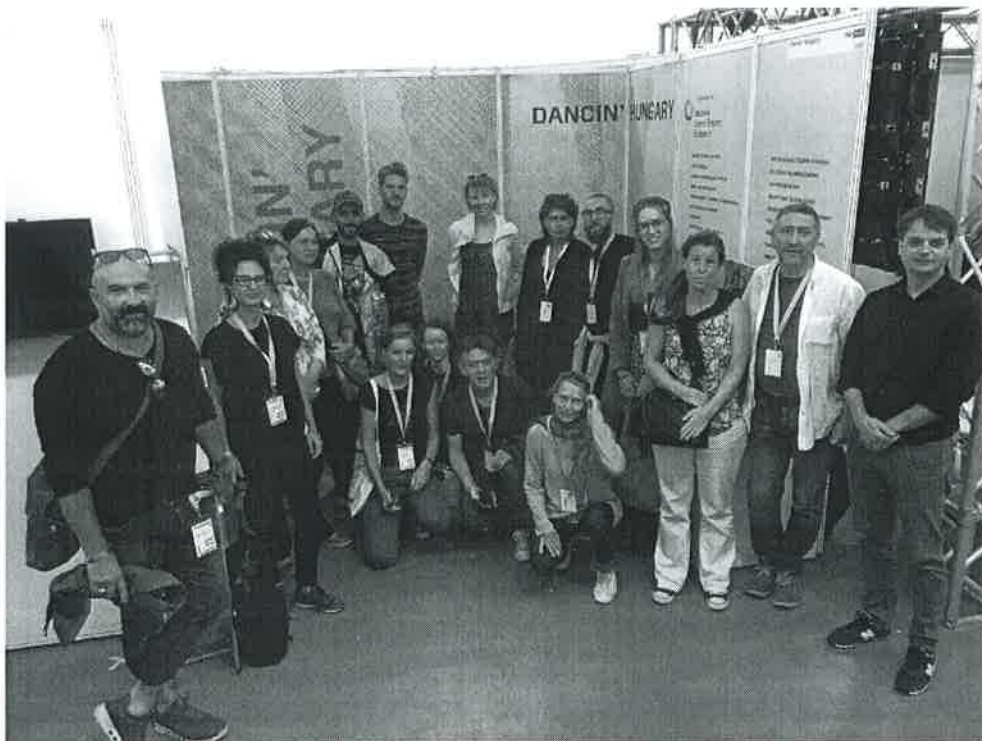
2018. évi résztvevők