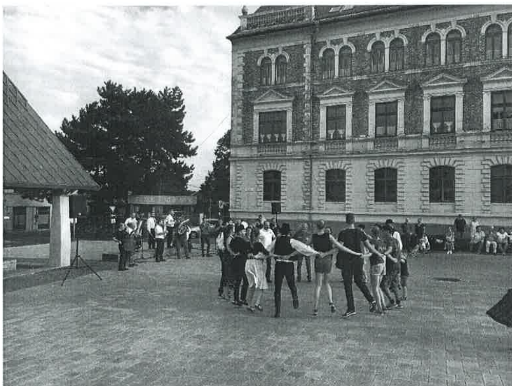
Táncház a Fő téren

A gyermek és felnőtt táncelőadások mellett, a fesztivál ideje alatt kísérőprogramként fotókiállítás volt látható a Balaton Színházban